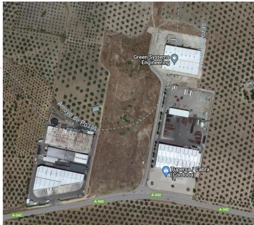
Extracto Visor IDE (Infraestructura de Datos Espaciales)

SÉTPIMO.- Debe tenerse en cuenta que en el ámbito de actuación transcurre el "Arroyo de Pozas".