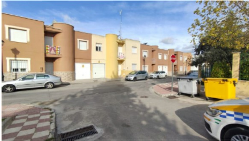
c/ José Cobo Puerto (tramo inferior). Posibilidad de girar a la derecha, convirtiendo la c/ Zaranda en una vía de doble sentido de circulación, en la que circulan ambulancias y se encuentra el parking subterráneo del CMI.

La calle C/ José Aumente Baena, en su tramo superior, yace una caseta de electricidad (Sevillana), asentada sobre la vía pública, concretamente en el espacio reservado para el estacionamiento de vehículos. Se trata de un obstáculo fijo, opaco, de grandes dimensiones, que limita gravemente la visibilidad de la intersección, además de convertir la circulación en doble sentido en un hecho muy peligroso.