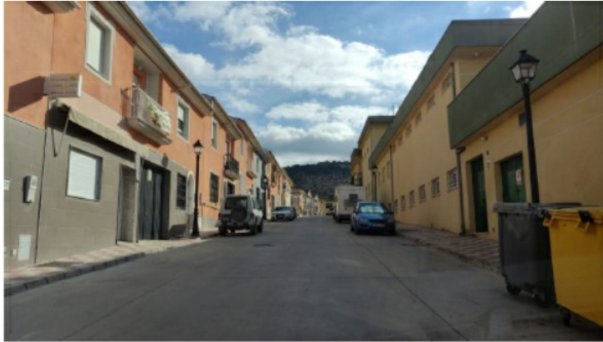
c/ José Aumente Baena. Estacionamiento en ambos márgenes de la vía. Circulación en doble sentido. Lugar de paso de ambulancias para el CMI.

La calle Zaranda, concretamente en el tramo comprendido entre c/ José Cobo Puerto y c/ José Aumente Baena, es de doble sentido de circulación. Se trata de una vía donde se encuentra el aparcamiento subterráneo del CMI, un peligro añadido al tráfico.