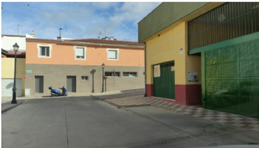
c/ Zaranda. Estacionamiento en ambos márgenes de la vía. Circulación en doble sentido. Lugar de paso de ambulancias para el CMI y entrada/salida de vehículos del aparcamiento comunitario subterráneo del CMI.

La calle Zaranda, concretamente en el tramo comprendido entre c/ José Cobo Puerto y c/ José Aumente Baena, es de doble sentido de circulación. Se trata de una vía donde se encuentra el aparcamiento subterráneo del CMI, un peligro añadido al tráfico.