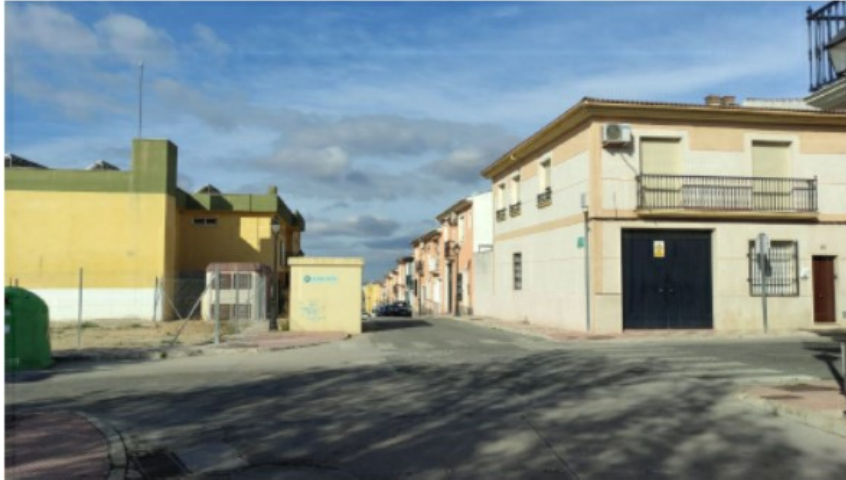
c/ José Aumente Baena. Estacionamiento en ambos márgenes de la vía. La caseta de luz sobresale de la zona reservada para el estacionamiento, imposibilitando la circulación en doble sentido, así como dificultando la maniobra de giro.

Que en orden a los criterios arriba narrados, con reportaje fotográfico que ilustra la explicación de la situación que nos ocupa, propone a esta Jefatura un cambio en la señalización actual.