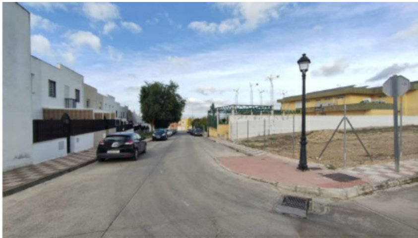
c/ José Cobo Puerto (tramo inferior). Estacionamiento en ambos márgenes de la vía. Circulación en doble sentido. Lugar de paso de ambulancias para el CMI.

Las calles C/ José Aumente Baena y c/ José Cobo Puerto (tramo inferior) se encuentran con doble estacionamiento y doble sentido de circulación. Sin lugar a dudas, concurren dos vías que por sus dimensiones y fluidez del tráfico rodado no hacen recomendable sino peligroso la señalización actual. Cabe añadir la circulación de ambulancias que realizan sus labores en el Centro Municipal Integrado (CMI), circulando indistintamente por cualquiera de estas calles para acceder y/o salir del edificio municipal.