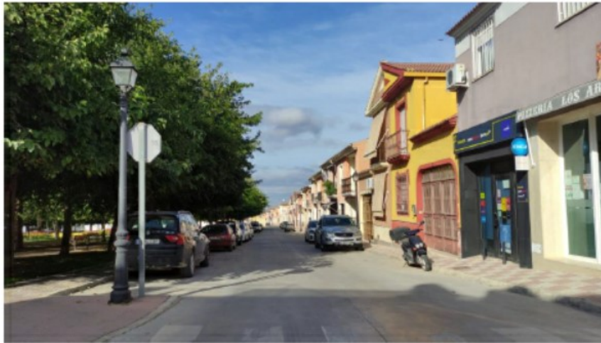
c/ Paula Montal. Estacionamiento en ambos márgenes de la vía. Circulación en doble sentido. Se trata de una zona de mucho tránsito de población infantil , con el riesgo de salida fortuita a la vía pública provocado por los juegos propios de su edad.

Las calles C/ José Aumente Baena y c/ José Cobo Puerto (tramo inferior) se encuentran con doble estacionamiento y doble sentido de circulación. Sin lugar a dudas, concurren dos vías que por sus dimensiones y fluidez del tráfico rodado no hacen recomendable sino peligroso la señalización actual. Cabe añadir la circulación de ambulancias que realizan sus labores en el Centro Municipal Integrado (CMI), circulando indistintamente por cualquiera de estas calles para acceder y/o salir del edificio municipal.